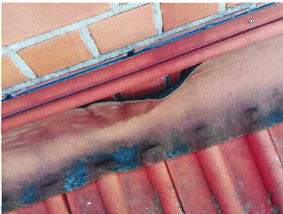
Rys. 4 – Zdjęcia izolacji komina.