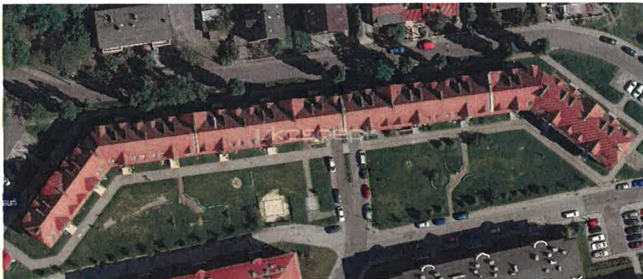
Rys.1. Widok z góry na dach budynku mieszkalnego przy ul. Stokrotek 2-26 w Opolu.